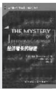
《经济增长的秘密》 赫尔普曼 著 王世华 吴筱 译 中国人民大学出版社 2007年3月出版

伟大的斯密在《国富论》中详细解释了分工专业化与市场交换提高了效率,而国际贸易又能使一国的财富效应扩散出去。李嘉图解释了这种扩散过程,以比较优势理论解释了何以生产本国具有比较优势的东西再相互交换对双方都有利。但马尔萨斯却指出了人口与资源之间的紧张关系,当然人类最终凭借生产率提高、技术进步和制度变迁克服了这一