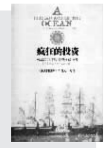
《疯狂的投资》 跨越大西洋电缆的商业传奇 (美)约翰·戈登 著 于倩 译 中信出版社2007年3月出版