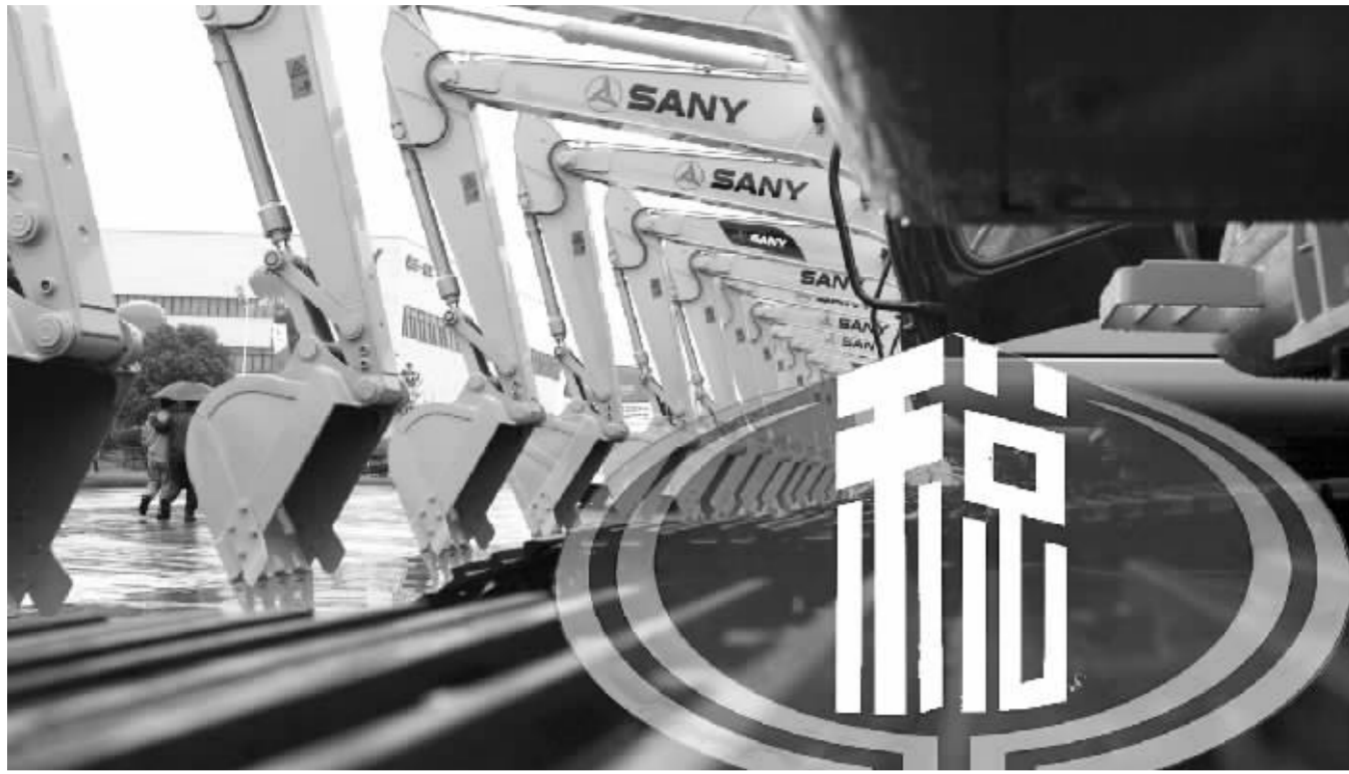
相对于东北试点而言,此次中部六省增值税转型增加了电力和采掘业 张大伟 制图

“事实上,中部地区试行增值税转型,其重要意义不仅在于为企业具体减轻多少税负,还体现在它是国家促进中部崛起一系列宏观经济政策中的一个重要切入点,是区域经济崛起的一个重要信号。”卢洪友说。