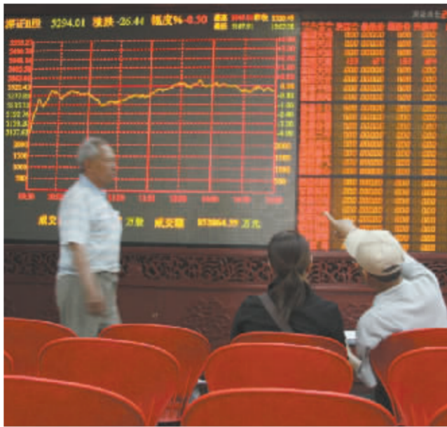
低开高走再次上演

和11693.85点大幅低开,随后股指就展开快速反弹并一举创出本轮行情新高,而且两市成交量较上周五放大二成左右,同时市场普涨格局明显,两市涨幅达10%的个股近80只,较上几个交易日明显增多,显示个股活跃度有所上升。 板块方面,煤炭、纺织机械、航空航天、飞机制造、汽车、塑料、水泥、仪器仪表等表现较好。从中可以发现,一些具有国际竞争力的制造业上市公司,明显受到了资金的重点关注。权重股整体表现还是较为平稳,其中银行股受加息影响,表现较为低调,但也基本符合市场预期;地产股由于融资渠道的改变,对加息不像以前那么敏感,小盘地产股表现尤为活跃。 针对后市,一些机构的观点认为,短线来看,在资金推动的格局下市场震荡走高的格局有望延续,只有当一系列宏观调控措施形成叠加效应之后,特别是在人民币升值势头全面缓解之后,资金过剩的局面才可能改观,市场的大趋势才有可能逆转。短期来看,充满赚钱效应的股市对散户的吸引力并未因调控而降低,但管理层使用市场化的调控手段并非一步到位,投资者还是应该重点审视所持有的股票是否具备投资价值