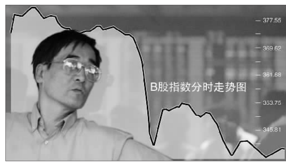
连续急涨的 B 股昨日盘中出现急跌,投资者忧心忡忡

新增资金的流入是推动 B 股市场近期大幅走高的主要因素,4 月 30 日至 5 月 18 日 B 股开户约 30 万户,超过了过去 2 年多的总和,部分股票在这 10 个交易日里出现了 8-11 个涨停。