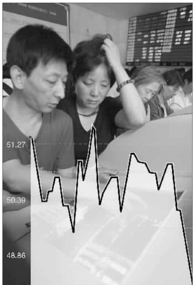
题材股炒作蕴含巨大风险 张大伟 制图

之所以如此,是因为此类个股的上涨缺乏基本面的强有力支撑,仅仅凭借着热门题材吹泡泡,从而使得股价过分脱离基本面,因此,一旦行情降温,后续资金跟风乏力,入驻其中的主力资金也会在获利颇丰后伺机减持套现,如此就推动着股价“跌跌不休”,渐渐打回原地。对此,有业内人士称题材股炒作相当于是沙丘上建房,虽然可以短期内搭高一点,但一有风吹草动,就会塌掉。最为典型的的就是 1999 年至 2000 年的网络