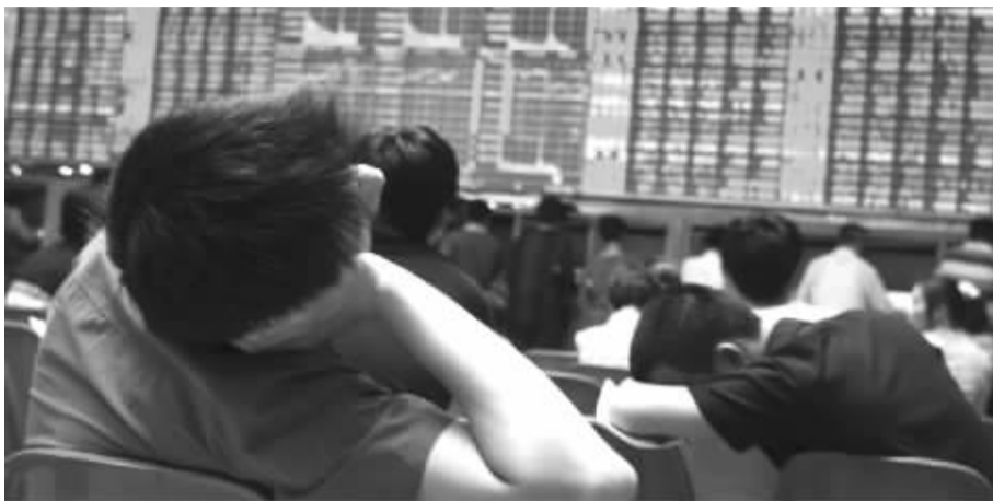
是赎回还是持有基金,这成了不少基民头疼的事情

收益犹豫不决。而据业内人士分析,基金公司也面临着投资者赎回和市场风险的双重压力。相关统计显示,4月16日至5月9日间,新华富时指数A50的基金规模急剧缩水达2180万份。