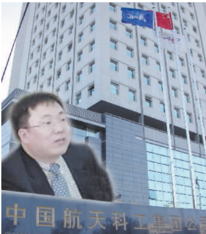
陈鹏飞“落马”前与控股股东间的争斗曾引人关注 张大伟 制图