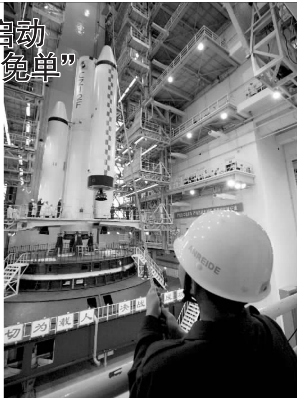
国有军工企业可望免于在2007年交红利 资料图

实际上,部分国企的收益还没有转移到社保的原因在于,国资委反对社保要求股权的方式,而建议用现金支付。理由如国资委官员接受采访时