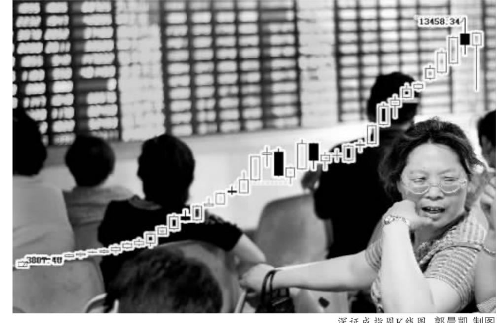
深证成指周K线图 郭晨凯制图

从周五的盘面看,投资者的“周末恐慌症”有所缓解,两市股指重心震荡上移,上证综指指向3900点上方,深证成指也逼近13000点,两市成交金额也基本平稳。板块上看,有色金属、封闭式基金、新能源