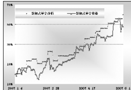
2007年以来封闭式基金净值和价格走势