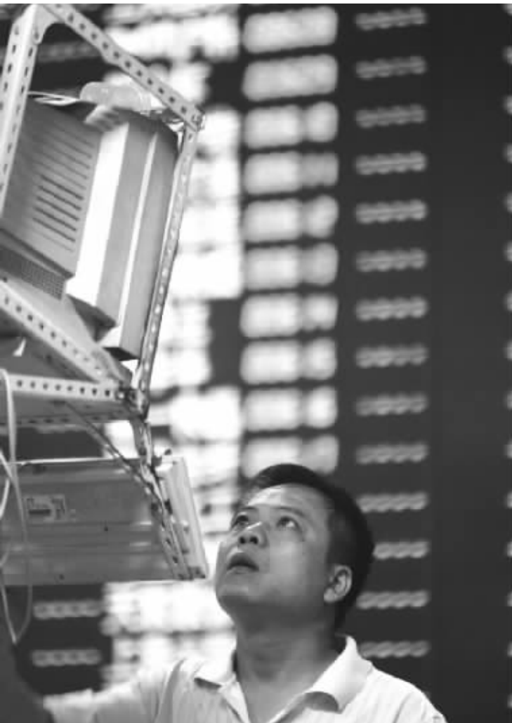
炒作题材股还得看仔细 资料图