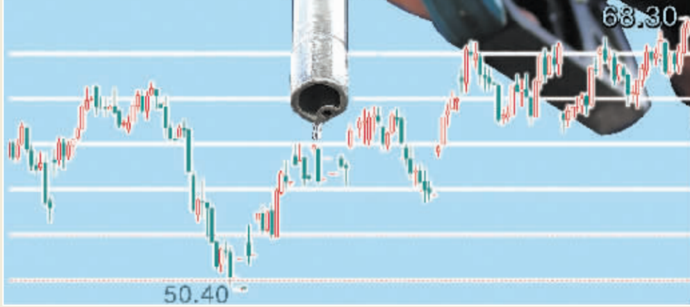
上周五收盘,纽约7月份原油期货合约上涨0.35美元,报每桶68.00美元,为连续第三个交易日收高,也创下2006年9月6日以来的收盘新高。盘中油价一度达到68.30美元。详见封五 张大伟 制图