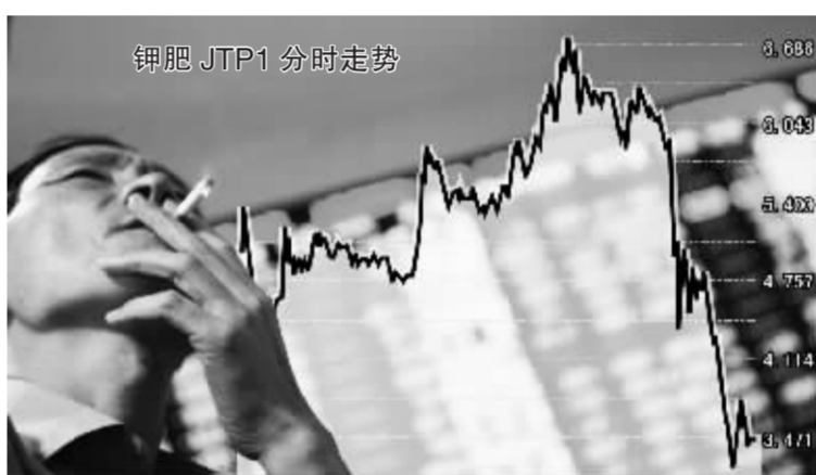
在昨日收盘前1个多小时,钾肥认沽权证风云突变 张大伟 制图

作为目前市场上唯一的可创设品种,招行认沽近日的暴涨引发了券商们的创设热情,6月14日以来,10多家创新券商总计创设了6.22亿份的招行认沽权证,占该权证流通量的20.62%。这些权证于昨日上市流通,对平抑招行认沽的投机起到了积极的作用。有关专家认为,招行认沽的行权价只有5.48元,按照招商银行昨日23.98元的收盘价,到期很可能是废纸一张。现在距离招行认沽的最后交易日只有两个月左右的时间,而券商创设一份招行认沽只需要冻结5.48元的资金,所以近期招行认沽的创设可能会继续进行。很明显,大量新创设权证的上市给招行CMP1的价格带来了较大的压力,促进了该权证走向价值回归。招行CMP1昨日亦大跌14.87%。