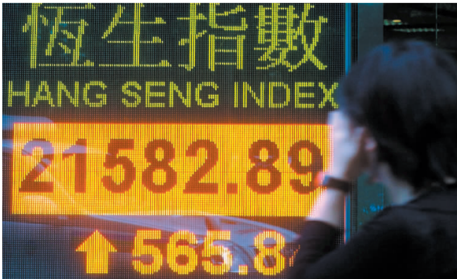
恒指昨日创下历史最高收盘纪录

中资电信股昨日也毫不逊色,中国移动、联通与中国电信这三只电信股昨日涨幅都超过5%,并同时创下上市以来的新高。受下月有望回归A股消息的推动,中移动获得机构的强烈追捧,急涨6%,力撑港股大市的表现,仅该股就贡献恒生指数202点的升幅。在中移动的带动下,联通也大幅上扬,收盘涨8.14%,同样,中国电信斥资14.1亿人民币收购母公司资产,股价涨近6%,不过中国网通仅升2.39%。