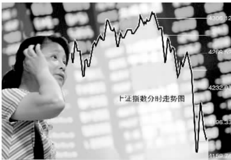
大盘在尾市出现一波快速下跌 张大伟 制图

盘面显示,昨天早盘多方快速启动中国人寿、中国平安等权重股带领大盘冲高,随后中国石化也上冲助阵,怎奈在沪指历史高点面前,投资者明显心态谨慎,追高热情不足,制约了反弹能量的释放。午后由于大盘冲高未果,引发短线获利盘兑现以及解套盘打压,再加上技术面上股指本周一留下的向上跳空缺口产生牵引力,因此两市大盘在2:30之后出现一波快速杀跌。从领涨板块来看,工行、招行为首的银行股板块,万科A为首的地产板块均有