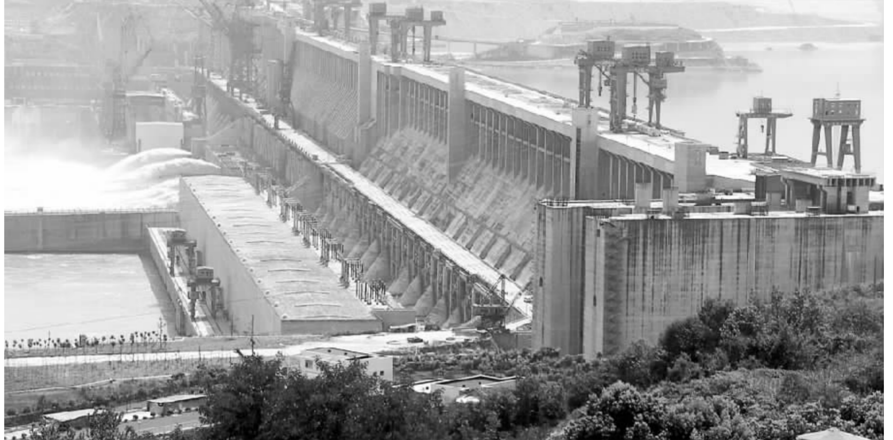
下半年大股东的资产注入值得期待 资料图

另外,承诺实现前提条件不满足、承诺期限不明确或者期限较长的尴尬局面也让人头痛不已。华电能源、现代制药等承诺要注入优质资产,却没有明确时间表;大冶特钢拟注入价值不低于3亿元,且按前一年度经审计的财务报表计算的净资产收益率不低于10%的优质资产,时间却是自股改之日起三年,公司2006年实施股改,履行期因此要到2009年。