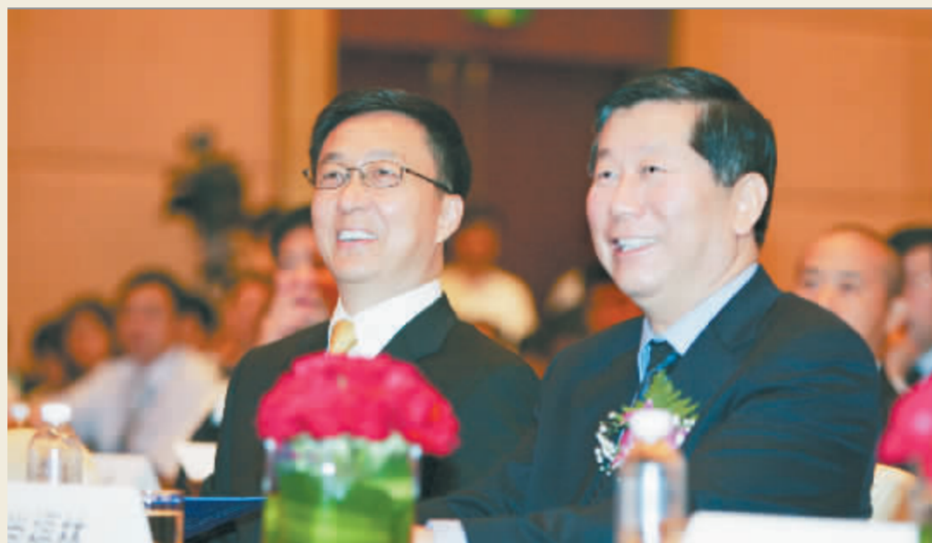
尚福林、韩正等昨日出席首届上市公司高峰论坛

证监会将着重做好五项工作:一是积极推进多层次市场体系建设;二是鼓励和吸引优质大型企业和成长性中小企业发行上市;三是健全和完善上市公司内部制衡机制;四是不断改进和加强上市公司监管;五是推进行业自律组织建设,逐步形成多层次全方位监管体系 证监会告诫上市公司“勿闯三个禁区”:一是坚决勿闯虚假信息披露的禁区;二是坚决勿闯操纵股价和内幕交易的禁区;三是坚决勿闯损害上市公司利益的禁区