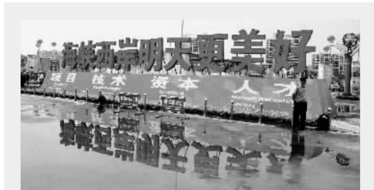
福建证监局将切实抓好上市公司(存量)和拟上市公司(增量)的各项基础性工作 资料图