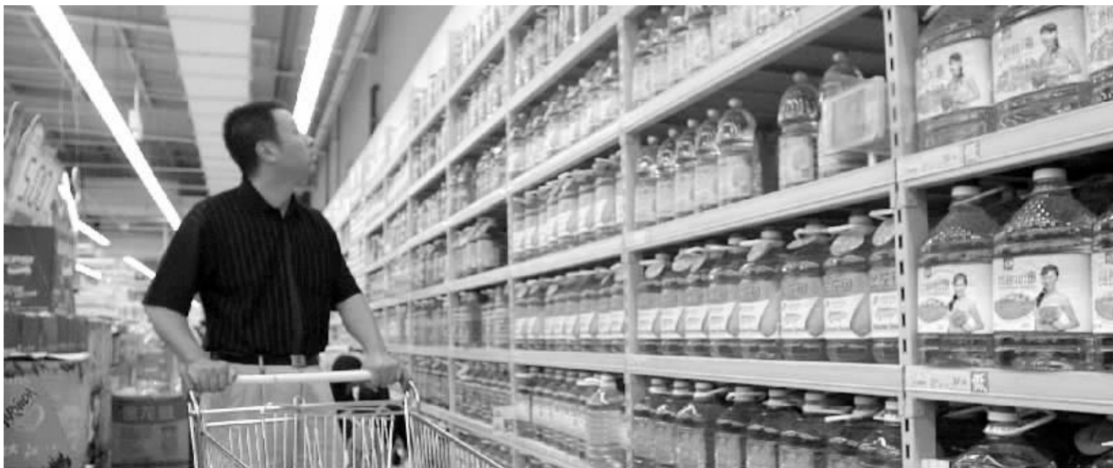
这次物价上涨,是在农产品价格长期较低的基础上发生的,是对农产品生产成本上升的一种合理补偿 资料图

随着改革开放的深化,我国对外依存度不断增强,国内市场受国际市场的影响越来越大。特别是近年来,随着石油价格的持续上涨,导致美国等国家大规模开发生物能源,利用玉米加工燃料乙醇、利用大豆制造生物柴油,对玉米、大豆等粮食需求量大增加,拉动国际市场粮价大幅上涨,进而带动国内粮价上升,并波及到以粮食为原料的食用油、肉、禽、蛋等主要副食品价格。粮、油、肉蛋等食品类价格上涨,成为推动当前价格总水平上涨较快的主要原因。