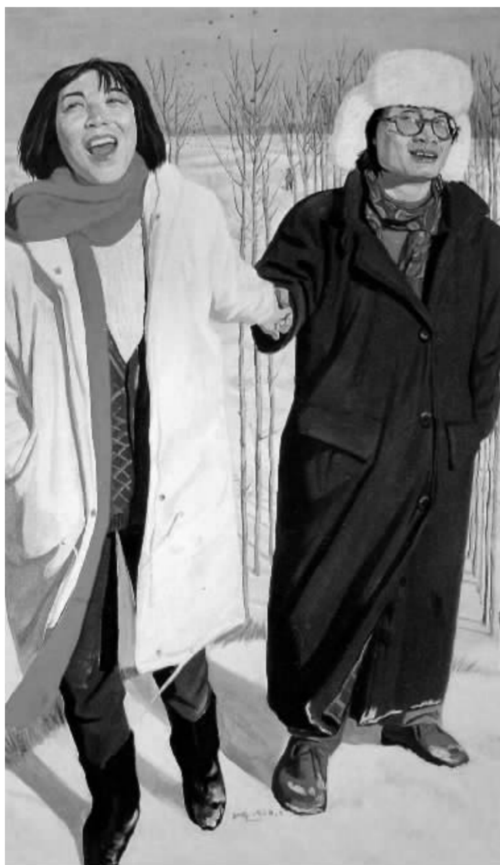
刘小东的《雪地侠侣》