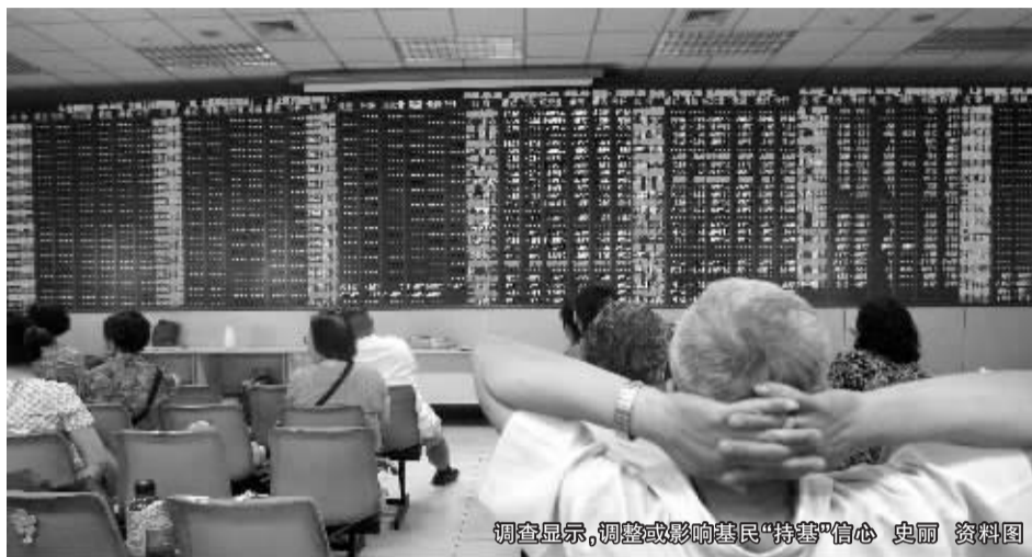
调查显示,调整或影响基民“持基”信心

中国证券网上周进行了“调整市,你会考虑‘换基’来降低成本吗?”的调查,共有3036人参与了投票。结果显示,有1446名投票者表示会“全部赎回”,占全部投票者总数的47.63%。有535名投票者表示会“持有资金”,占投票者总数的18.64%。此外,表示会“换基”的投票者约占全部投票者总数的35%。其中,“换强势基金”的投票者有566人,占到全部投票者的18.64%。“换封闭式基金”的有433人,占全部投票者的