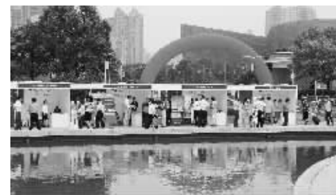
上海基金业投资者教育活动现场