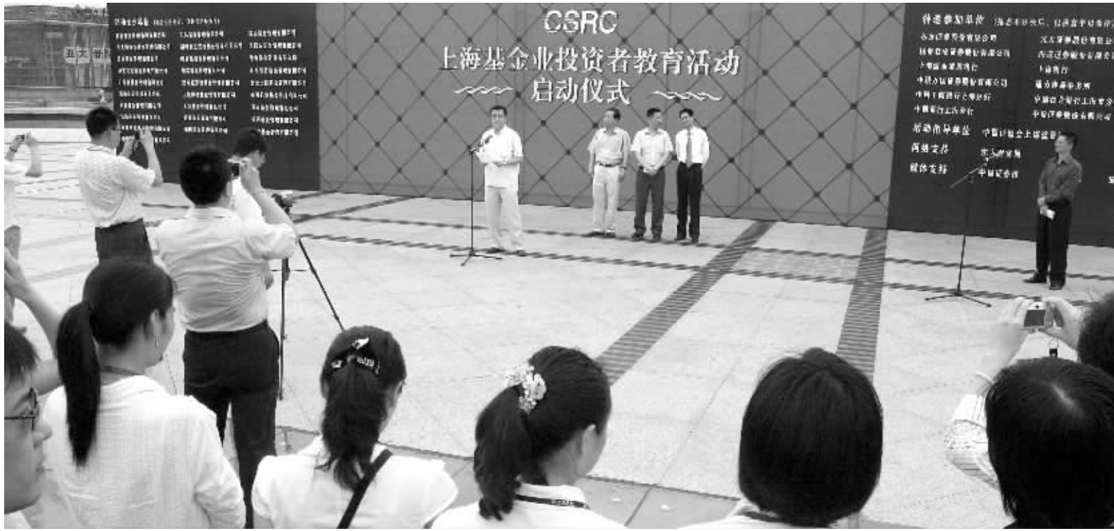
上海基金业投资者教育活动启动仪式昨在浦东举行

最新数据显示,截至2007年6月30日,国内基金总资产净值已经达到15077.33亿元,较2006年末整整增加了6582.95亿元。与之相随的是,基金投资者队伍迅速壮大。统计显示,仅在2007年以来的半年内成立的新基金总申购户数就达到1308.59万户,与前六年发行的全部基金申购总户数基本持平。这给监管部门进行投资者教育活动提出很大的挑战。