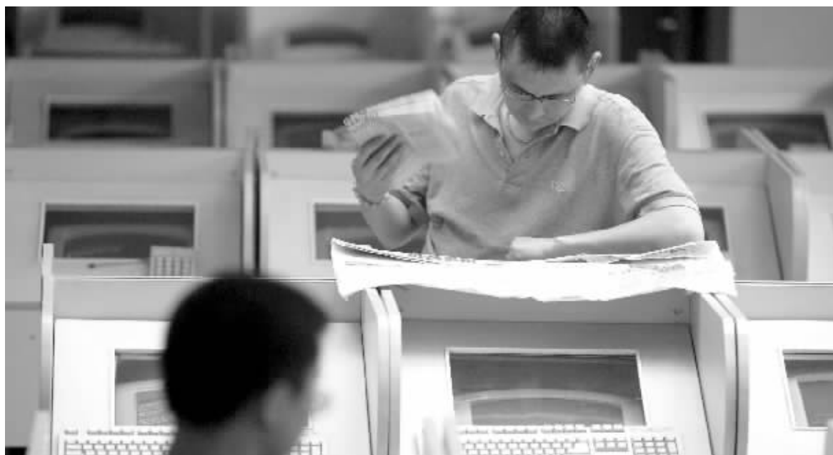
目前市场看空情绪高涨 资料图

报告指出,总体来看,人民币升值、产业结构及消费升级和放松管制与资源要素价格改革将共同构成