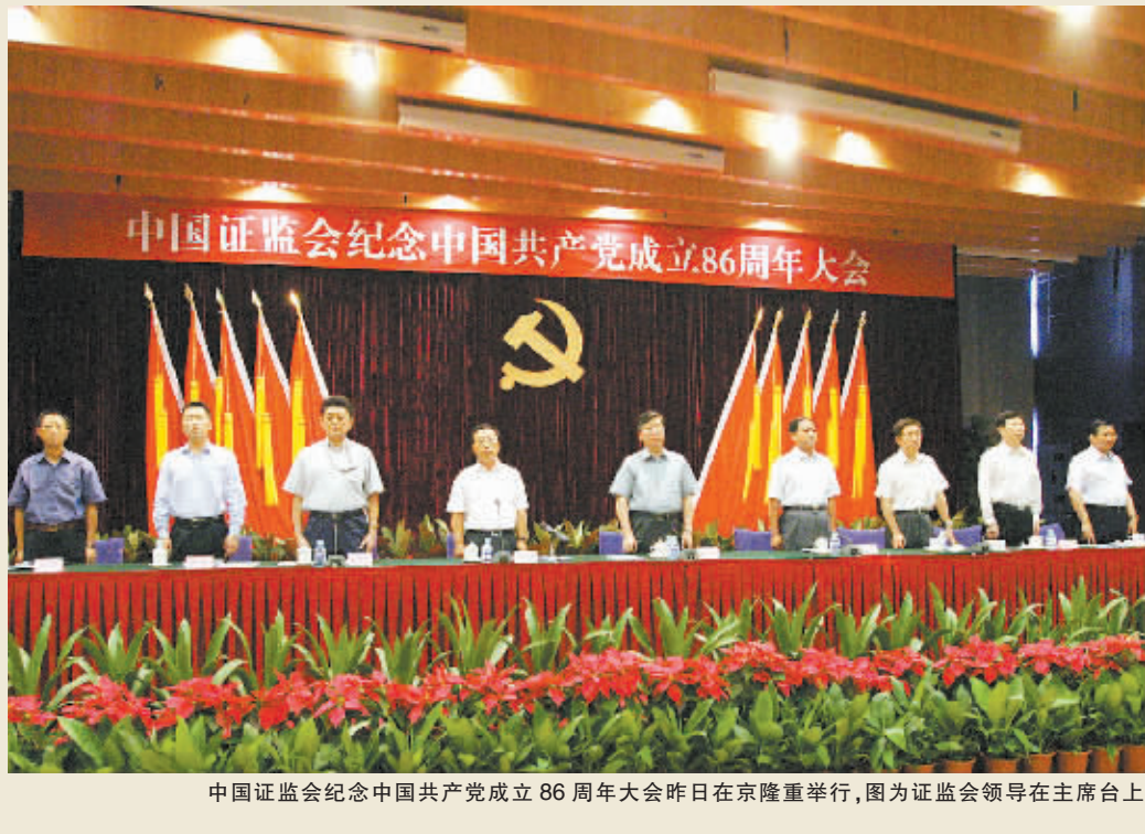
中国证监会纪念中国共产党成立86周年大会昨日在京隆重举行, 图为证监会领导在主席台上