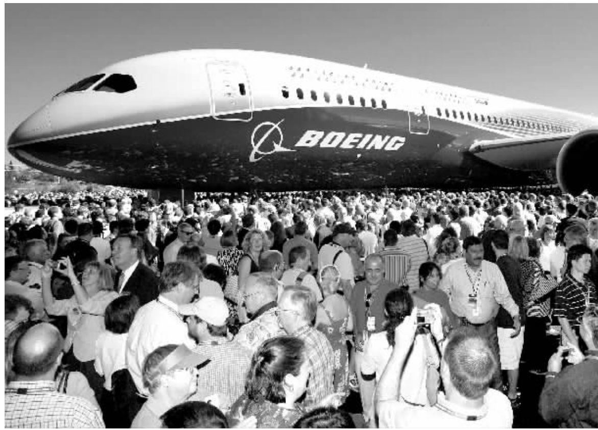
波音787“梦想”客机亮相现场

据悉,空客在2013年将推出A350客机,与787客机竞争。卡塔尔航空公司在上月18日已订购80架A350客机,金额达160亿美元。其中20架属于标准型250座位客机,另外40架和20架分别是297座位和350座位客机。250至359座位的A350客机平均售价为2.29亿美元,而787客机的平均售价为1.58亿美元。