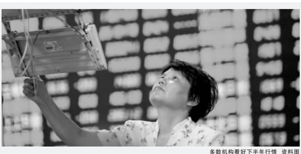
多数机构看好下半年行情 资料图

针对后市,有些机构的观点认为,由于短线反弹较急,市场心态尚未企稳,反弹领涨品种也以低价股的超跌反弹为主,加上其他一些政策因素有待进一步明确,因此短线反弹并不意味着阶段性调整已经结束,60日均线有阻力,反弹结束后仍有探底要求,未来股指有望在3300至3500点区间反复震荡筑底,短线追高需要谨慎。