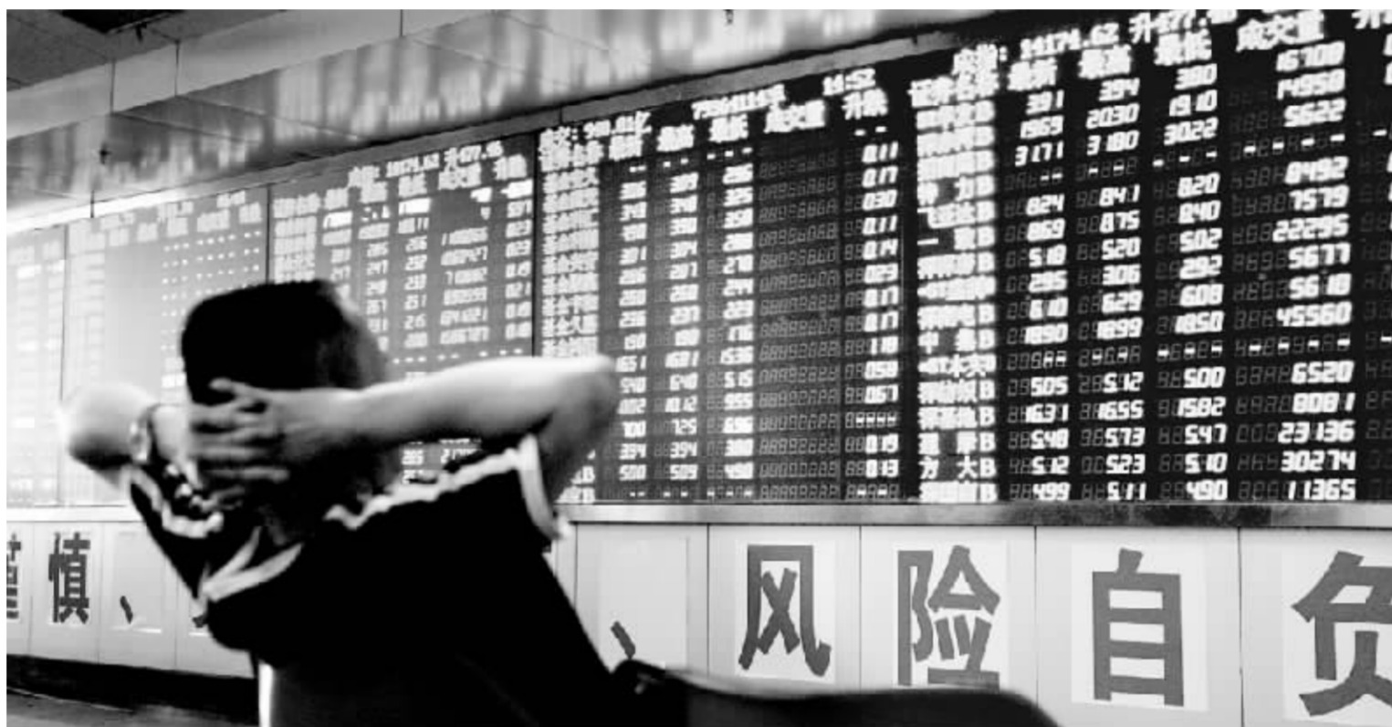
全国人大常委会法工委、国务院法制办负责人郑重提醒,对非法证券活动,公众务必提高警惕,避免使自己的财产遭受损失

该负责人提醒,从事非法集资活动的下场,最高可判死刑。我国刑法规定,对以非法占有为目的,使用诈骗方法非法集资的,最高可判死刑,并处没收财产。