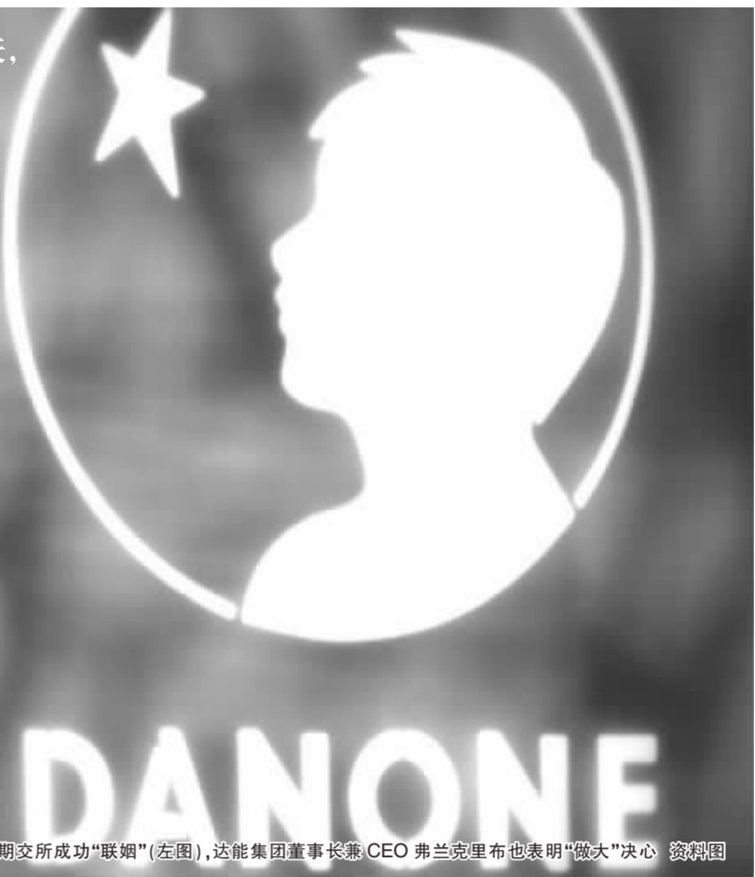
芝加哥商交所与期交所成功“联姻”(左图),达能集团董事长兼CEO弗兰克里布也表明“做大”决心 资料图

而在大洋彼岸的欧洲,法国食品巨头达能集团也在上周的“虚晃一枪”之后使出了“真功夫”。达能在9日宣布,以123亿欧元(约合170亿美元)收购荷兰营养食品集团纽米克,从而有望缔造出全球新的营养保健行业龙头。