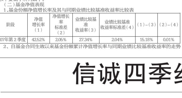
信诚精萃成长股票型证券投资基金净值增长率与同期业绩比较基准收益率的走势对比图

基金业绩表现: 基金业绩表现良好，符合基金合同预期。本期净值增长率为42.52%。