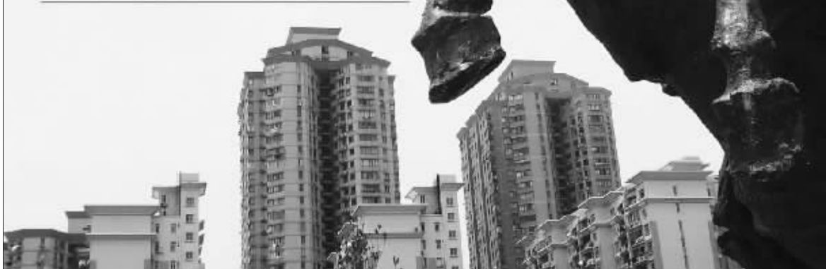
张大伟制图