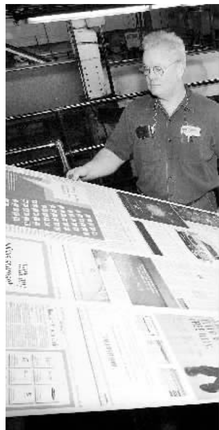
《华尔街日报》印刷车间 资料图

据悉,在新闻独立方面,道琼斯已于本月初与新闻集团达成妥协,双方初步敲定了一份关于维护编辑独立的协议,旨在通过防止编辑工作的最高负责人受到雇主干涉。协议还提出设立一个包括五位成员组成的特别委员会,来防止道琼斯公司三大主管编辑的工作受到新闻集团干涉,这三人分别是《华尔街日报》的主管编辑和社论版编辑,以及道琼斯通讯社主管编辑。