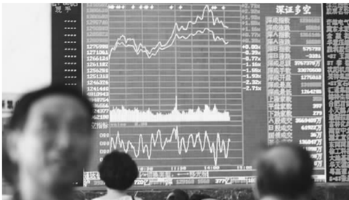
周三大盘延续反弹走势,沪指站上3930点

是左右大盘涨跌的主导力量。据统计,昨天沪市A股中对指数贡献度最大的为中国人寿,贡献点位为14点,其次为大唐发电、大秦铁路、中国银行、长江电力和中国国航;深市A股方面指数最大贡献最大的为万科A,贡献11点,其次为金融街、盐湖钾肥、招商地产、泸州老窖和潍柴动力,相反鞍钢