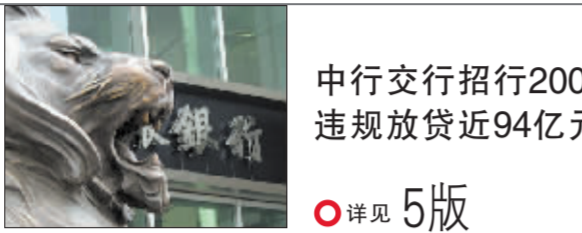
中行交行招行2005年 违规放贷近94亿元