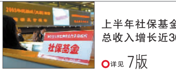
上半年社保基金 总收入增长近30%