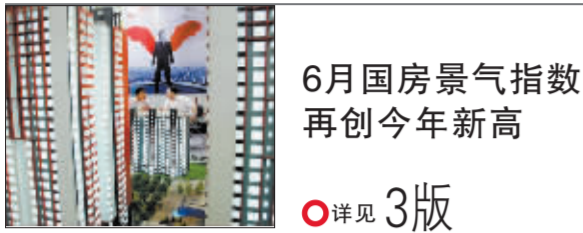
6月国房景气指数再创今年新高