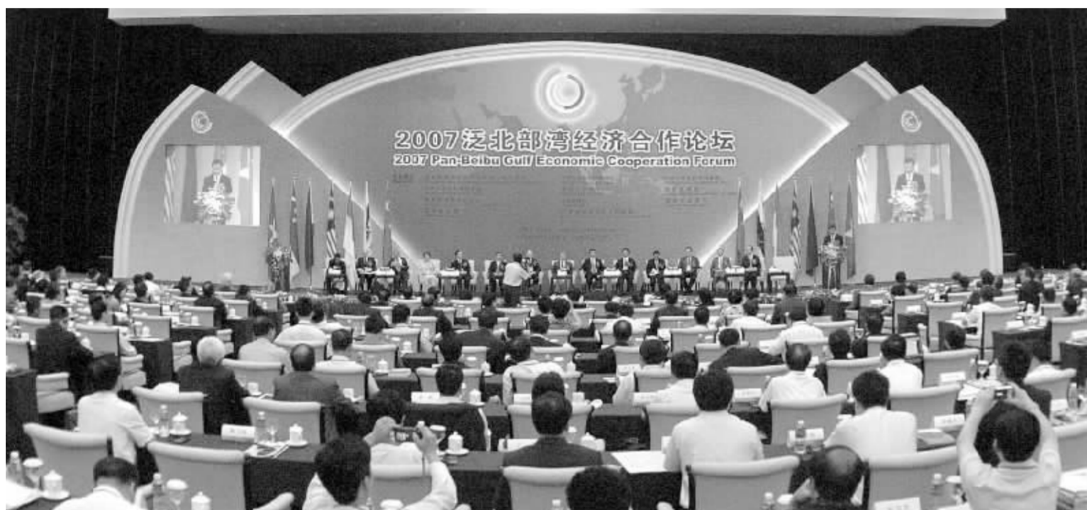
26日,2007泛北部湾经济合作论坛在广西南宁开幕,此次论坛主题为“共建中国-东盟新增长极,新平台、新机遇、新发展”。

泛北部湾经济合作区包括中国、越南以及马来西亚、新加坡、印尼、菲律宾和文莱等7个国家,是中国-东盟自由贸易区的重要组成部分。2006年中国与泛北部湾区域6国的贸易额为1307亿美元,增长22.6%,占中国与东盟贸易总额的81.3%。