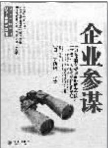
(日)大前研一著 裴立杰译 中信出版社 2007年8月出版

“日本战略之父”大前研一30至31岁初进麦肯锡公司时所做的笔记不意竟成了全球畅销书,并荣膺“全球50本最有影响力的管理书”之一,在今天仍然被不少公司用于培训新员工,这恐怕也是大出大师人意料。要说个中缘由,大前研一本人认为是忠实反映了第一次石油危机时日本所经历的艰辛,那种对未来的危机感。而在西方人看来,《企业参谋》提出了一个全新的观点:为发展有效的战略,管理者必须首先获得某种环境下对各种影响因素详尽而准确的理解,然后通过联系企业各部分资源开发出一个整体性的规则,以形成具有竞争力和效率的运作模式。此即所谓企业无论处于何种困境,都能从中找到制订战略规划的方法。