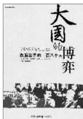
《大国的博弈》改变世界的一百八十天 (美)玛格丽特·麦克米兰著 刘彦汝 译 重庆出版社 2006年8月出版

麦克米兰不仅是视野开阔的历史学教授,也是一位有魅力的、直率的、有趣的(有时甚至是搞笑的)作家,作为劳合·乔治的曾孙女,她继承了英国人传统的傲慢和玩世不恭,在坚实的学术史料基础上,能以轻松幽默的笔调尽情戏虐后世的政治雕像,那些让当事人有“切肤之痛”的嘲讽令人过目不忘。