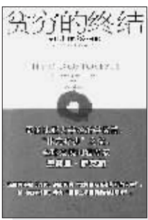
The End Of Poverty: Economic Possibilities For Our Time (美)杰弗里·萨克斯(Jeffrey Sachs)著 邹光译 上海人民出版社 2007年8月出版 北京世纪文景文化传播有限公司出品

消除贫困是全球的责任,没有哪个国家能独立完成这项任务。全球化思考,艰难就难在这里,但这恰是21世纪全球化社会所要求的。曾直接参与联合国千年计划等重大社会改革项目、担任联合国前秘书长科菲·安南特别顾问的萨克斯教授对当今世界每年有800万人因极端贫困而死的现状陈述是沉重的,而他以自己的亲身体会作为线索,断言贫穷并非与生而来,私人市场力量与公共政策的相互补充,加上更为和谐的全球治理体系,人类完全有能力在2025年消灭极端贫困的结论又是乐观的。在他眼中,财政陷阱、政府失灵、文化障碍、地缘政治和人口问题才是真正的病根所在,而结束贫困的关键在于让穷人走上发展的阶梯,这需要基础设施、公共建设、人力资本等方面的投资,需要各发达国家及国际机构的支持与援助。