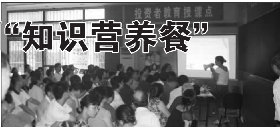
附:国泰君安证券南昌股民学校6月份授课回顾

为了激发投资者的学习兴趣,提高投资者的参与度,营业部在授课形式和授课内容上进行了创新,把知识性、实用性、趣味性很好地结合起来,形成了一套全新的教学流程。同时还使用了多媒体教学手段,使枯燥、抽象的理论知识讲解变得通俗易懂,受到了投资者的好评。整个课程始终把风险教育放到首要位置,把防范风险作为培训的主线,贯穿始终。许多投资者都表示,通过参与这样的讲座不仅使自己在专业知识上大有收获,同时也认识到证券市场的风险,增强了风险防范意识,从而坚定了投资者理性投资的信心。