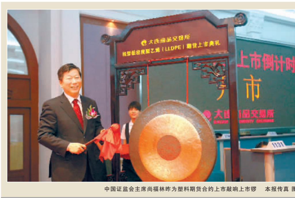
中国证监会主席尚福林昨为塑料期货合约上市敲响上市锣 本报传真图

尚福林说,线型低密度聚乙烯是重要的石油化工产品,消费量中的76%用于生产塑料薄膜,对农业生产影响较大。我国线型低密度聚乙烯产量和进口量均居世界前列,进口依存度近50%,市场价格受国际市场影响较大。线型低密度聚乙烯期货上市,能够为石油化工、农业生产资料等上下游相关企业提供风险管理工具,提升企业在国际贸易中的主动性和竞争力。相关报道详见A8