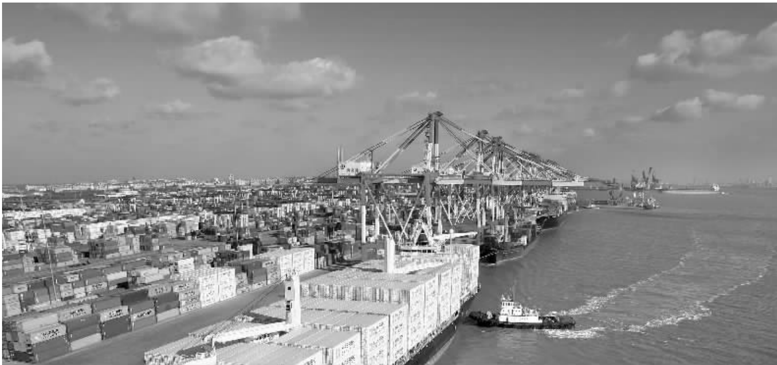
我国各地区 GDP 的统计是分别统计的,在计算投资、贸易的过程中,GDP 的加总过程就不可避免会重复计算 资料图

在两级 GDP 差额已经不是秘密的同时,有理由要问,为什么这种差额会在大家关注的眼光下,会再度扩大。