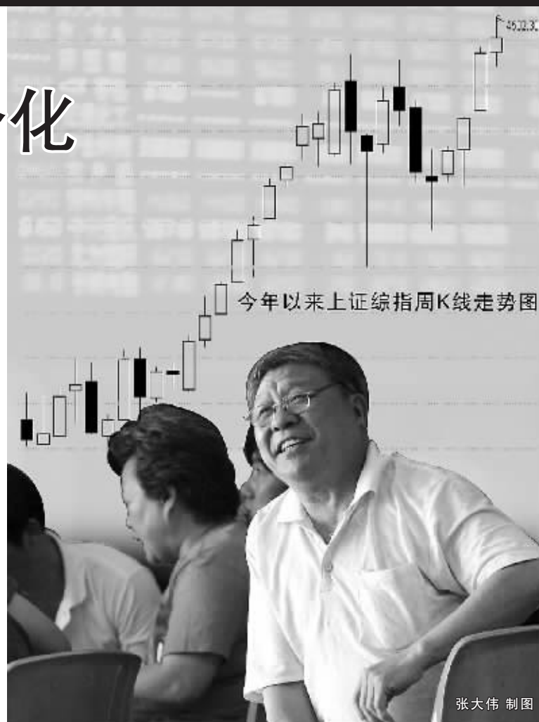
今年以来上证综指周K线走势图

上海证券的观点是,8 月份上证综指的表现更多地反映市场的局部行情,而无法反映市场的全貌。在资金推动减弱以及资金理性程度提高的判断下,情绪化行情和相对估值