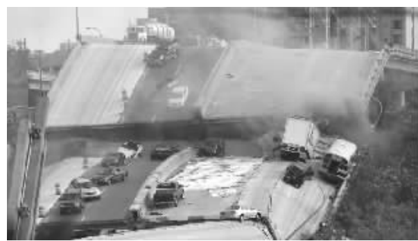
桥梁坍塌现场