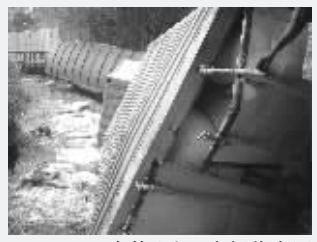
事故现场 本报传真图

刚果(金)政府发言人图桑·奇伦博·森德说:“根据我们获得的信息,这次火车出轨事故已造成至少100人死亡,220人受伤,其中128人重伤。”联合国驻刚果(金)维和部队的发言人卡迈勒·赛基早些时候说,此次事故造成至少68人丧生,128人严重受伤。