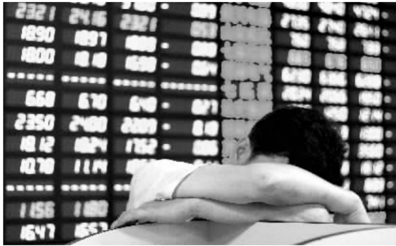
大多数的投资者不得不对“赚了指数不赚钱”的尴尬境地 资料图

分析人士认为,正是基金为首的主流资金大举拉抬权重指标股,才造成了目前大盘表面上的繁荣景象。在指数失真的背景下,投资者操作难度大大增加,同时也埋下了指数进行调整的伏笔。