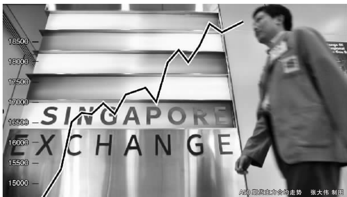
A50 期货波动合约的走势 张大伟制图