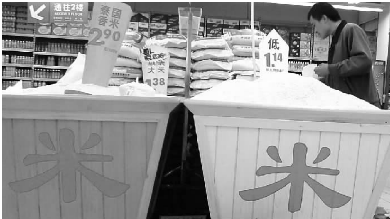
进入8月以来,一些农副产品批发市场中的大米、猪肉,其价格的环比增长已经为零 资料图

据了解,猪肉价格上涨后,带动了牛羊肉、禽蛋、水产品等替代品价格分别上涨了20%、28%和15%左右。重庆市食用油价格也从7月下旬开始上涨,8月初菜色拉油同比上涨38.7%。