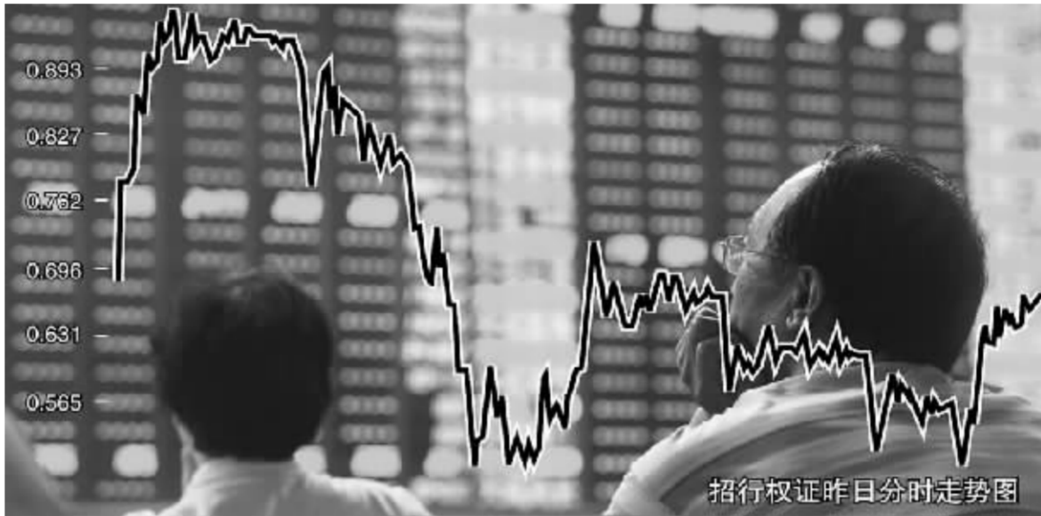
招行权证昨日分时走势图 张伟大 制图

招行 CMP1 最后交易日为本月 24 日,一些业内人士指出,招行认沽权证到期内在价值几乎肯定为零,这一轮炒作主要是少数权证大户带动下,大量缺乏风险意识的散户投资者盲目跟风的结果。近日,上证所已经多管齐下强化权证监管,通过限制交易,临时停牌等措施打击违规交易,提示交易风险。目前,招行权证仅剩 6 个交易日,继续在权证二级市场上“博傻”投机无异于火中取栗。