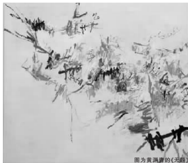
图为黄渊青的《无题》