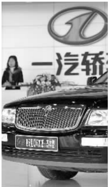
本报记者 徐汇 资料图