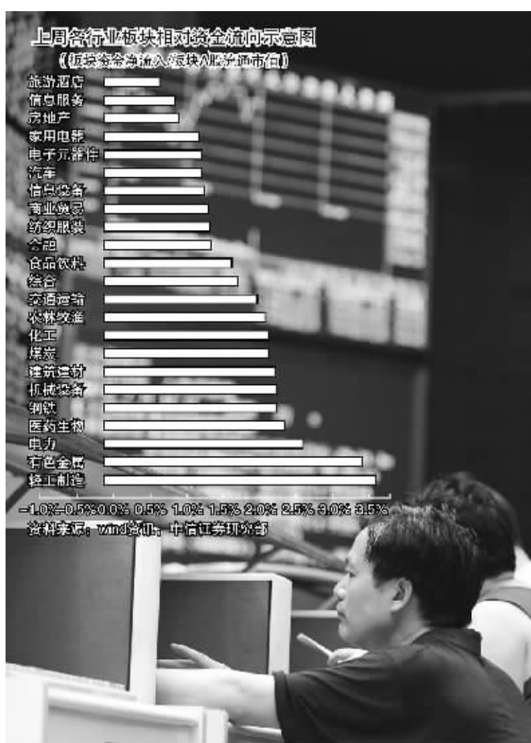
徐汇 资料图 张大伟 制图

前期表现较好的银行板块,指南针软件显示,机构对大部分股票仍然延续加仓动作,其中华夏银行机构加仓了近四个百分点,是银行