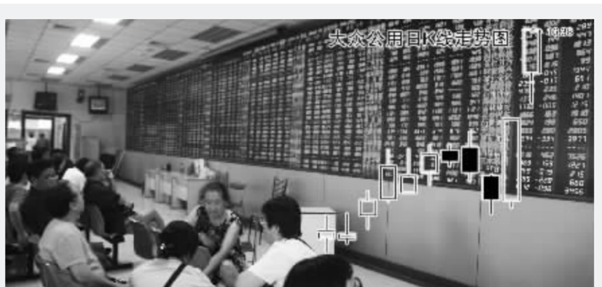
创投概念股大众公用连续两天涨停 史丽 资料图 张大伟 制图

的走势看,多空的搏杀异常激烈。昨日的公开信息显示,继续加仓中铝和包铝的仍以散户居多,而机构都现身于卖出前列。其中,两家机构卖出包头铝业2.6亿元,一家机构卖出中国铝业5239万元。但也有受到机构一致加仓的个股,云铝股份就被三家机构合计净买入1.78亿元,却没有机构抛出。而机构对南山铝业和焦作万方的分歧就显得较为明显。南山铝业的龙虎榜上,出现四家机构买入而五家机构卖出;而焦作万方的买卖前列各出现了四个机构席位。