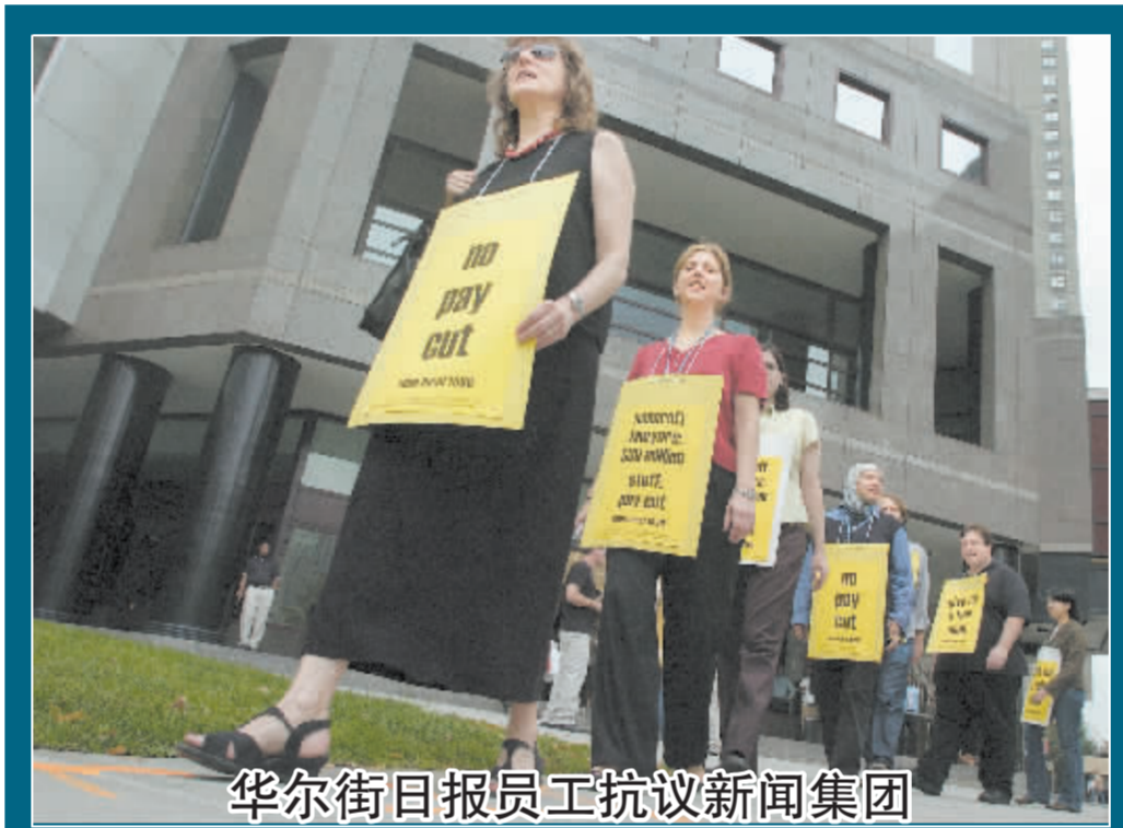
华尔街日报员工抗议新闻集团

9月10日,《华尔街日报》员工在道琼斯公司总部前举行抗议活动,对新闻集团收购道琼斯提出不满,反对新闻集团新合约的“变相降薪”。 新闻集团对道琼斯的收购过程并不顺利。班氏家族一直“举棋不定”,态度暧昧;一方面默许克开出的收购价确实极具诱惑力,另一方面,又遭到部分股东及《华尔街日报》的坚决反对。持续了数月的谈判,双方才在8月初最终宣布达成一致。