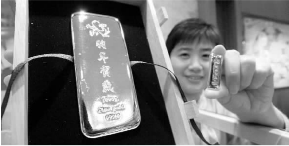
黄金是国内期货市场迎来的又一“重量级”品种 资料图

管理层正式批复上海期货交易所开展黄金期货交易业务,意味着地下炒金的生存空间彻底被封死,对广大投资者而言,是一个令人振奋的消息。在正规渠道建立后,投资黄金期货终于变得名正言顺。根据上海期货交易所11日晚公布的黄金期货标准合约征求意见稿,黄金期货合约每手300克黄金,若按金价每克170元估算,黄金期货每手合约价值约为51000元;最低交易保证金为合约价值的7%,加上期货公司收取的佣金,每手黄金期货最低保证金约为5000元左右。上期所同时公布《上海期货交易所风险控制管理办法》还显示,根据客户持仓量和合约上市运行的不同阶段,黄金期货保证金占合约价值的份额在7%至20%之间变动,即每手合约所需保证金在5000元至11000元之间变动。