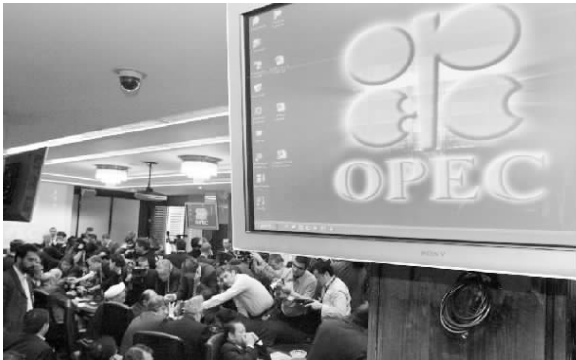
欧佩克部长级会议决定,从今年11月1日起将该组织的原油日产量上限提高50万桶

分析人士指出,之所以欧佩克最终仍作出了上述象征性举动,背后可能主要是沙特的原因。沙特目前是欧佩克最大成员,也是全球最